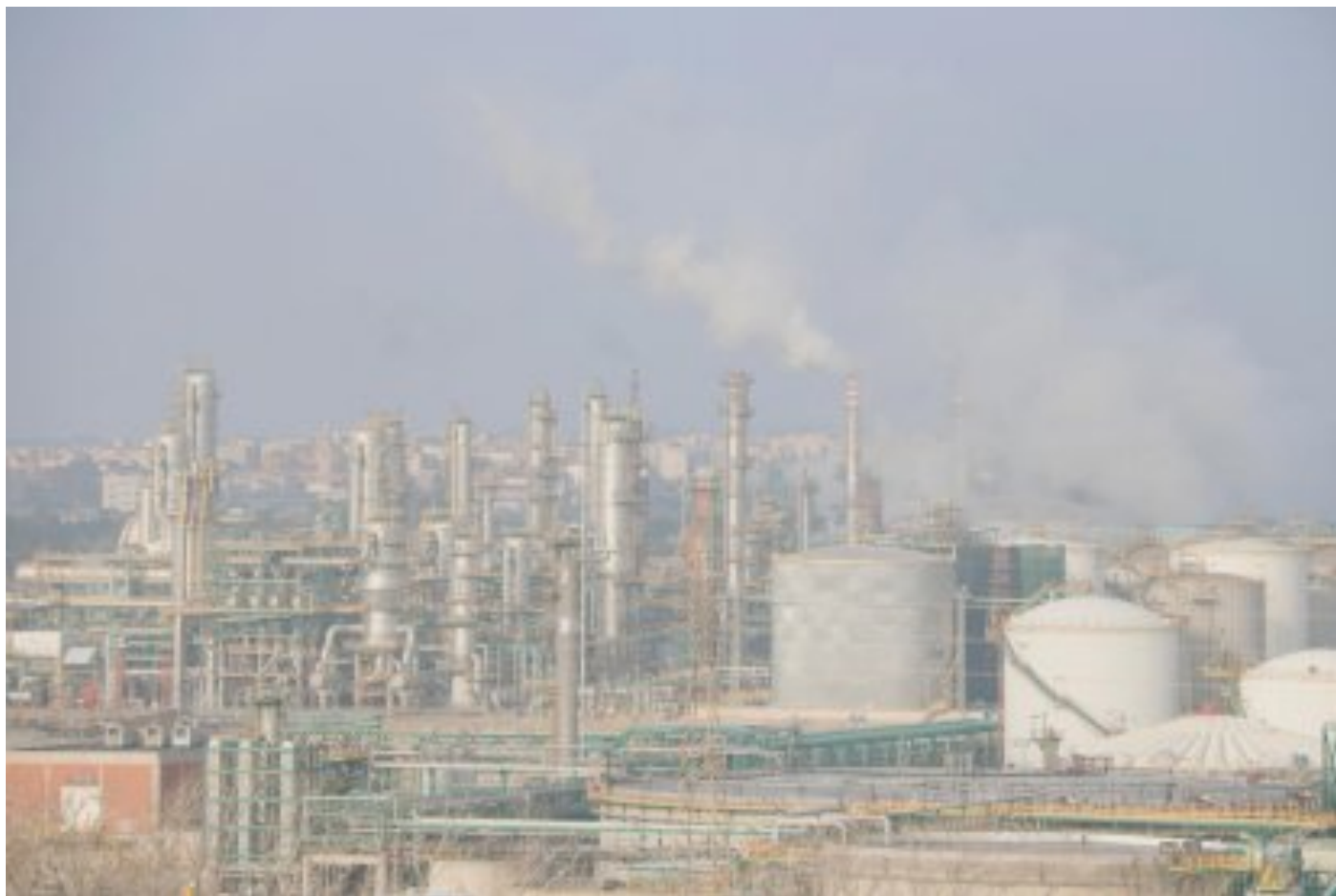
L'Observatori de la Qualitat de l'Aire a Tarragona mesura per primer cop puntes de butadiè